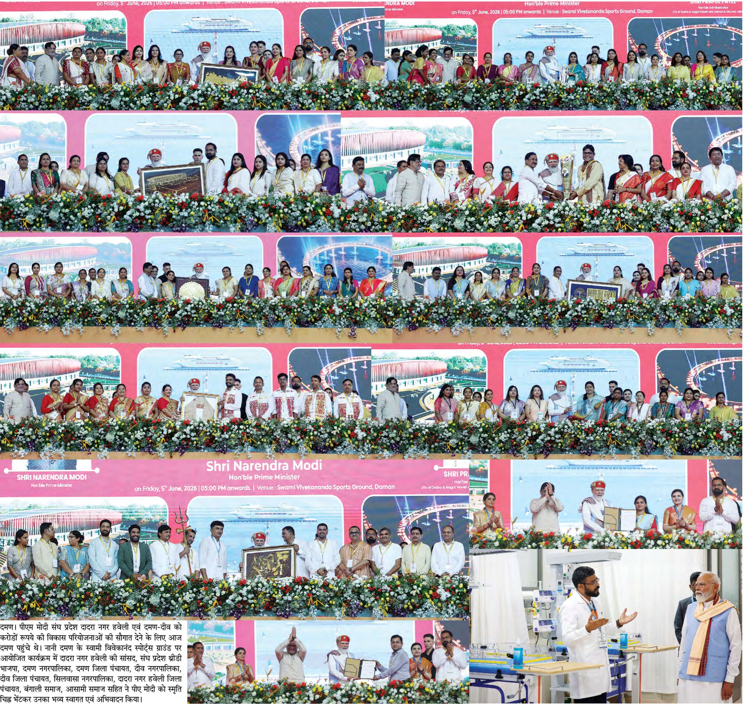
दमण। पीएम मोदी संघ प्रदेश दादरा नगर हवेली एवं दमण-दीव को करोड़ों रुपये की विकास परियोजनाओं की सौगात देने के लिए आज दमण पहुंचे थे। नानी दमण के स्वामी विवेकानंद स्पोर्ट्स ग्राउंड पर आयोजित कार्यक्रम में दादरा नगर हवेली की सांसद, संघ प्रदेश श्रीडी भाजपा, दमण नगरपालिका, दमण जिला पंचायत, दीव नगरपालिका, दीव जिला पंचायत, सिलवासा नगरपालिका, दादरा नगर हवेली जिला पंचायत, बंगाली समाज, आसामी समाज सहित ने पीएम मोदी को स्मृति चिह्न भेंटकर उनका भव्य स्वागत एवं अभिवादन किया।