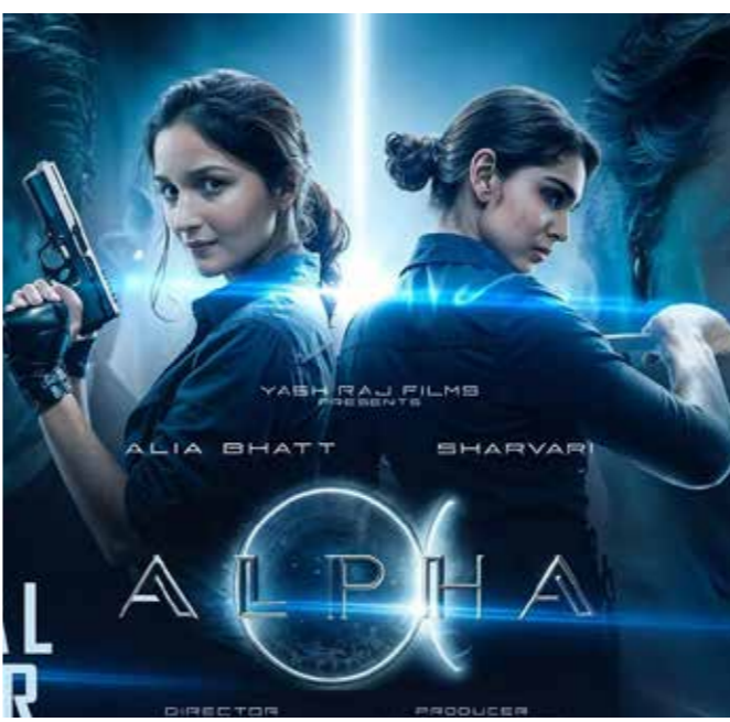
खान भी अल्फा में पठान के रूप में कैमियो करेंगे, लेकिन इसकी कोई पुष्टि नहीं हुई है।

इस वजह से अल्फा को अब बॉक्स ऑफिस पर पूरी तरह से खुलने के लिए दो सप्ताह का समय मिलेगा, खासकर इसलिए क्योंकि 10 जुलाई को कोई भी बॉलीवुड फिल्म सिनेमाघरों में रिलीज नहीं हो रही है। रिपोर्ट में कहा गया है कि अल्फा की रिलीज डेट पहले ही तय कर दी गई है, लेकिन निर्माताओं ने अभी तक आधिकारिक तौर पर इसकी घोषणा नहीं की है। अल्फा, वाईआरएफ के स्पाई यूनिवर्स के तहत बनी पहली फीमेल लीड फिल्म है। इस फिल्म में बांबी देओल और अनिल कपूर भी अहम रोल में हैं। खबरों के मुताबिक, श्रुतिक रोशन फिल्म में कैमियो कर सकते हैं। यहां तक खबरें थीं कि शाहरुख