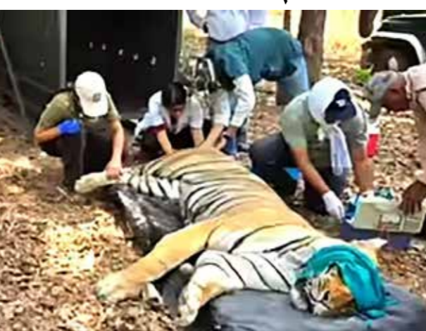
मप्र में 10 बाघ और गुजरात में 12 शेरों की मौत से मचा हडकंप

देखभाल केंद्र का दौरा किया। पिछले 15 दिनों में 12 शेरों की मौत के बावजूद रिपोर्ट जारी न होने से मामला और गहराता जा रहा है। गुजरात वन-विभाग चुप्पी सांथें हुए है गुजरात में करीब 8 दिन पहले 5 शावकों और 4 शेरों मौत हुई थी। इनके नमूनों की जांच के बाद भी वन विभाग की ओर से अभी तक कोई रिपोर्ट जारी नहीं की गई है। हालांकि, सीडीवी जैसे गंभीर लक्षणों के चलते वन विभाग ने सतर्कता बरतते हुए काम शुरू कर दिया है। लेकिन आशंका है कि स्थिति