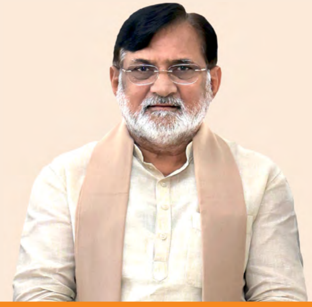
श्री प्रफुल पटेल माननीय प्रशासक दादरा एवं नगर हवेली तथा दमण एवं दीव और लक्षद्वीप