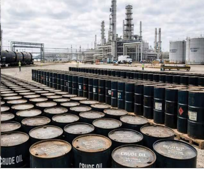
रणनीतिक भंडार मौजूद है। इस गंधारी स्थिति को देखकर मोदी सरकार को पांच प्रमुख क्षेत्रों कच्चा तेल, खाद, रेयर अर्थ मटेरियल, जरूरी दवाइयां और

नई दिल्ली (एजेंसी)। वैश्विक तनाव और कच्चे तेल की बढ़ती कीमतों के बीच, कंसल्टेंसी फर्म ने भारत को भविष्य के संकटों से बचने के लिए एक बड़ा रणनीतिक भंडार तैयार करने की चेतावनी दी है। फर्म की मई 2026 की रिपोर्ट के अनुसार, भारत के पास वर्तमान में केवल 4-5 दिनों की घरेलू जरूरतों को पूरा करने के लिए ही कच्चा तेल रणनीतिक भंडार में है, जो आम लोगों की जेब पर पेट्रोल, डीजल, एलपीजी और खाद की कीमतों में भारी उछाल के रूप में सीधा असर डाल सकता है।