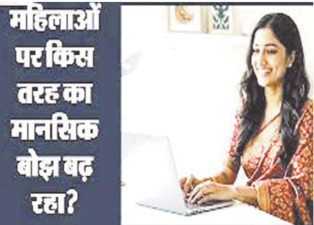
महिलाओं पर किस तरह का मानसिक बोझ बढ़ रहा? यही लगातार चलने वाला मानसिक दबाव महिलाओं को भावनात्मक रूप से थका देता है।