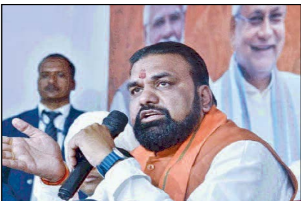
योजनाओं के लिए चुना गया। 26 स्टार्टअप को पहली किस्त की मंजूरी रिपोर्ट के मुताबिक 26 स्टार्टअप को पहली किस्त के रूप में चार-चार लाख रुपये की सहायता देने की अनुशंसा की गई है।

योजनाओं के लिए चुना गया। 26 स्टार्टअप को पहली किस्त की मंजूरी रिपोर्ट के मुताबिक 26 स्टार्टअप को पहली किस्त के रूप में चार-चार लाख रुपये की सहायता देने की अनुशंसा की गई है। वहीं 46 स्टार्टअप को दूसरी किस्त के तहत छह-छह लाख रुपये की वित्तीय सहायता मिलेगी चार स्टार्टअप को मिलेगा पोस्ट-सीड फंड राज्य सरकार ने चार स्टार्टअप को पोस्ट-सीड फंड सपोर्ट योजना के तहत चुना है। इन स्टार्टअप को 15-15 लाख रुपये की सहायता राशि दी जाएगी। इसके अलावा एक स्टार्टअप को पेटेंट के लिए आईपीआर यानी इंटेलेक्टुअल प्रॉपर्टी राइट्स प्रतीति का लाभ देने की भी अनुशंसा की गई है। सिर्फ फंड नहीं, पूरा सपोर्ट सिस्टम स्टार्टअप बिहार के तहत उद्यमियों को केवल आर्थिक सहायता ही नहीं दी जा रही है। सरकार की ओर से मेंटरशिप, इन्क्यूबेशन, आधारभूत सुविधाएं और इन्वेंशन आधारित इकोसिस्टम का भी समर्थन दिया जा रहा है। सरकार का उद्देश्य युवाओं को नौकरी खोजने वाला नहीं, बल्कि नौकरी देने वाला उद्यमी बनाना है। बिहार बन रहा उभरता स्टार्टअप हब पिछले कुछ वर्षों में बिहार में स्टार्टअप की संख्या लगातार बढ़ी है। निवेशकों की रुचि भी राज्य की ओर तेजी से बढ़ रही है। उद्योग विभाग का मानना है कि मजबूत नीतियों, संस्थागत सहयोग और युवाओं की भागीदारी की वजह से बिहार अब देश के उभरते स्टार्टअप हब के रूप में अपनी पहचान बना रहा है। बिहार है तैयार अभियान को मिल रही मजबूती राज्य सरकार बिहार है तैयार अभियान के तहत उद्योग, नवाचार और रोजगार सृजन को बढ़ावा देने पर लगातार काम कर रही है। सरकार का दावा है कि आने वाले समय में बिहार स्टार्टअप और इन्वेंशन के क्षेत्र में नई ऊंचाइयों को छुएगा।