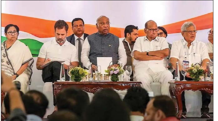
हालिया चुनाव परिणामों ने साफ संकेत दिया है कि भारतीय जनता पार्टी लगातार मजबूत हो रही है, जबकि कई क्षेत्रीय दलों की राजनीतिक पकड़ कमजोर पड़ी है। पश्चिम बंगाल में ममता बनर्जी,

नई दिल्ली (एजेंसी)। पांच राज्यों के विधानसभा चुनावों में विपक्षी दलों को मिली हार के बाद इंडिया गठबंधन एक बार फिर सक्रिय होता दिखाई दे रहा है। सूत्रों के मुताबिक विपक्षी गठबंधन के प्रमुख नेताओं को अहम बैठक जून के पहले सप्ताह में हो सकती है। माना जा रहा है कि यह बैठक छह जून को आयोजित की जा सकती है। पश्चिम बंगाल और असम में मिली हार के बाद गुणमूल कांग्रेस प्रमुख ममता बनर्जी ने विपक्षी एकता को मजबूत करने की जरूरत पर जोर दिया है। ममता बनर्जी ने इंडिया गठबंधन की बैठक बुलाने की मांग करते हुए कहा कि वर्ष 2029 के लोकसभा चुनाव से पहले विपक्ष को एकजुट होना होगा। राजनीतिक विश्लेषकों का मानना है कि