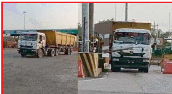
में पोकलैंड व पनडुबो मशीनों का इस्तेमाल कर रेत निकाली जा रही है। जिला प्रशासन ने अवेध खनन पर पाबंदी लगाने का दावा करते हुए संबंधित विभागों को सख्त कार्रवाई के आदेश जारी किए हैं। बावजूद इसके अवेध खनन के सिंडिकेट के आगे प्रशासन के खड़े भी हवा हो गए। हालात यह है कि नेशनल हाइवे पर बने टोल प्लाजा से जहां बिना फास्टेज लगे वाहनों का निकलना मुश्किल बना हुआ है। उन्हीं टोल प्लाजा पर बिना नंबर के रेत से भरे ओवरलोड

अमेठी (एजेंसी) उत्तर प्रदेश के अमेठी जनपद में बकरीद (ईद-उल-अजहा) का पर्व इस वर्ष पशु शांति, सौहार्द और भाईचारे के माहौल में संपन्न हुआ। जिले की सभी 112 इदगाहों और प्रमुख मस्जिदों में सुबह से ही नमाज अदा करने के लिए लोगों की भारी भीड़ उमड़ी। नमाज के दौरान लोगों ने मुल्क में अमन-चैन, तरक्की और खुशहाली की दुआ मांगी। नमाज के बाद लोगों ने एक-दूसरे को गले मिलकर ईद की मुबारकबाद दी और भाईचारे का संदेश दिया। संवेदनशील स्थानों पर पुलिस की कक्ष की तैनाती की गई है। उन्होंने बताया कि गौसंरक्षण कार्यों में आधुनिक तकनीकों का भी उपयोग किया जा रहा है। जीपीएस और जीआईएस आधारित गोचर भूमि प्रबंधन, मोबाइल चारा बैंक, हाइड्रोपोनिक ग्रीन फोड यूनिट, बायोगैस एवं जैविक खाद इकाइयों तथा सोलर ऊर्जा आधारित जल पंप जैसी व्यवस्थाएं विकसित की जा रही हैं।