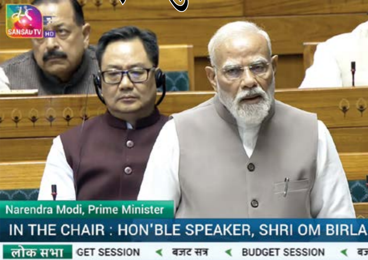
Narendra Modi, Prime Minister

IN THE CHAIR : HON'BLE SPEAKER, SHRI OM BIRLA