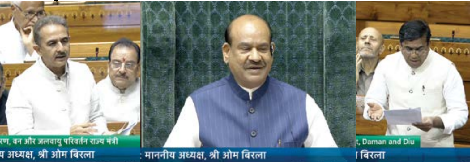
पर्यावरण, वन और जलवायु परिवर्तन राज्य मंत्री